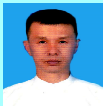
ဦးစိုင်းရှဲ့နီတစ်လုံ မိုင်းယောင်း(၂)