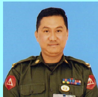
ဗိုလ်မှူးနေမျိုးဦး