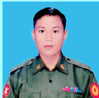
ဗိုလ်မှူးကျော်ဇေယျ