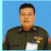
ဗိုလ်မှူးစိုးသူရ