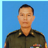
ဗိုလ်ကြီးဆန်းလင်း