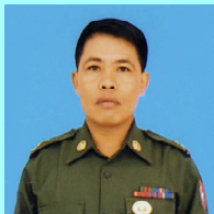
ဗိုလ်ကြီးစိုးခိုင်