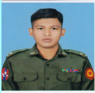
ဗိုလ်မှူးဖြိုးဝေဇော်