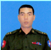
ဗိုလ်ကြီးတေဇာအောင်