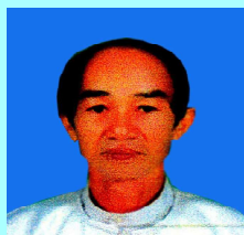
ဦးစိုင်းကျောက် မိုင်းဖြတ်(၁)