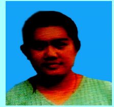
ဒေါ်နန်းဖွေးဟွမ်ဦး မောက်မယ်(၁)