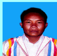
ဦးအန်းဂျေလို ဖယ်ခုံ(၂)