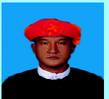
ဦးခွန်ဒီဂေါလ် လွိုင်လင်(၁)