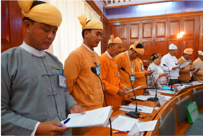
ဒုတိယအကြိမ်ရှမ်းပြည်နယ်လွှတ်တော်အစည်းအဝေးတွင် လွှတ်တော်ကိုယ်စားလှယ်များ ကတိသစ္စာပြုနေစဉ်

(၈.၂.၂၀၁၆)ရက်နေ့(၁၁:၀၀)နာရီအချိန်တွင် ပြည်နယ်လွှတ်တော်ကိုယ်စားလှယ်များသည် ၂၀၁၃ ခုနှစ် တိုင်းဒေသကြီး/ပြည်နယ်ဆိုင်ရာ ဥပဒေပုဒ်မ ၈(က)အရ သဘာပတိရွှေ့မှောက်တွင် ကတိသစ္စာပြုခြင်းနှင့် ကတိ သစ္စာပြုလွှာပေါ်တွင် လက်မှတ်ရေးထိုးခြင်းများ ဆောင်ရွက်ခဲ့ ပါသည်။