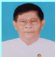
ဒေါက်တာအောင်သန်းမောင် ဗမာတိုင်းရင်းသားလူမျိုး ကိုယ်စားလှယ်