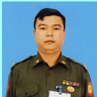
ဗိုလ်မှူးအောင်ဇော်မျိုး