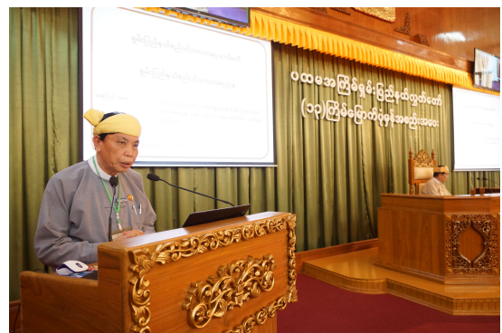
ရှမ်းပြည်နယ်အစိုးရအဖွဲ့၊ ပြည်နယ်စည်ပင်သာယာရေးဝန်ကြီး ဦးစိုင်းလှဝင်းမှ ရှမ်းပြည်နယ်စည်ပင်သာယာရေးကော်မတီ၏လုပ်ငန်းဆောင်ရွက်ချက်များအားရှင်းလင်းနေစဉ်