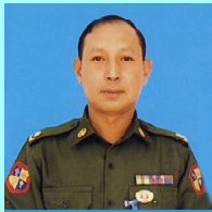
ဗိုလ်မှူးအောင်သူခိုင်