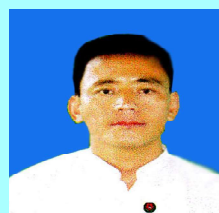
ဦးအားကို မိုင်းဖြတ်(၂)