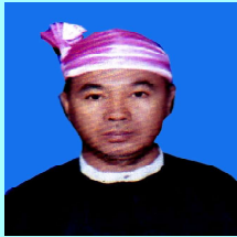
ဦးအလှိုင်စဉ် မန်တုံ(၂)