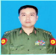
ဗိုလ်မှူးကြီးစိုးမိုးအောင်