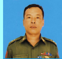
ဗိုလ်ကြီးမြင့်ထွန်းနိုင်