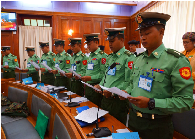
ဒုတိယအကြိမ်ရှမ်းပြည်နယ်လွှတ်တော်အစည်းအဝေးတွင် လွှတ်တော်ကိုယ်စားလှယ်များ ကတိသစ္စာပြုနေစဉ်