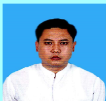
ဦးအာကာလင်း ပင်းတယ(၁)