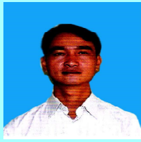
ဦးစိုင်းကျော်ဇေယျ(ခ)စိုင်းယဉ် လဲချား(၁)