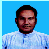
ဦးစိုးညွန့်လွင်(၁)ဦးစိုးကြီး ကလေး(၁)