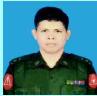
ဒုတိယဗိုလ်မှူးကြီးသန်းလွင်