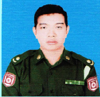
ဗိုလ်မှူးဇော်ထွန်း