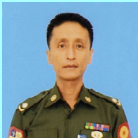
ဗိုလ်မှူးဇော်မိုးလွင်