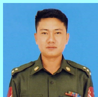
ဗိုလ်ကြီးမျိုးကိုကိုဝင်း