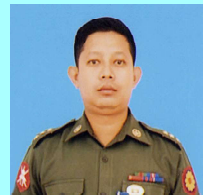
ဗိုလ်ကြီးအောင်ကျော်မြင့်ဝင်း