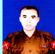
ဗိုလ်မှူး/ဗိုလ်ကြီးညီညီမင်း