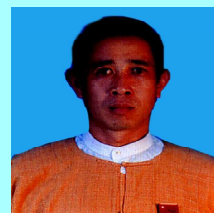
ဦးအိုက်ခမ်းလှိုင် မိုင်းယောင်း(၁)