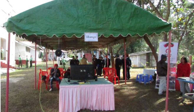
သတင်းMedia များ သတင်းမှတ်တမ်း ရယူနေပုံ

ဒုတိယအကြိမ်ရှမ်းပြည်နယ်လွှတ်တော် ပထမပုံမှန်အစည်းအဝေးတွင် သတင်းMedia များအား ခွင့်ပြုဆောင်ရွက်မှုအခြေအနေ (၈-၂-၂၀၁၆)ရက်နေ့တွင် ကျင်းပပြုလုပ်သော ဒုတိယအကြိမ် ရှမ်းပြည်နယ်လွှတ်တော် ပထမပုံမှန် အစည်းအဝေးတွင် သတင်းMedia များအား လွတ်လပ်စွာ သတင်းရယူနိုင်ရန်အတွက် သတင်းရယူခွင့်တင်ပြ လာသော ရှမ်းပြည်နယ်ပြန်ကြားရေးနှင့် ပြည်သူ့ဆက်ဆံရေးဦးစီးဌာန၊ Southern Shan State Media Network၊ သျမ်းသံတော်ဆင့်၊ Myanmar's Time၊ The People's Voice၊ Seven Day News၊ Eleven Media Group တို့အား ခွင့်ပြုပေးခဲ့ပါသည်။