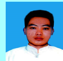
ဦးအားမဲ မိုင်းခတ်(၂)