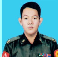
ဗိုလ်မှူးမျိုးမင်းသူ