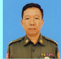
ဗိုလ်မှူးအောင်မျိုးကြည်