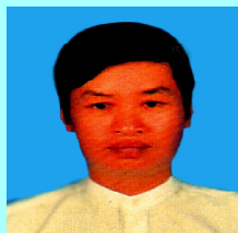
ဦးစိုင်းဝန်းဆမ် မိုင်းခတ်(၁)