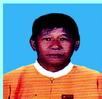
ဦးညို(၁)ဦးညိုလေးချင်း ပင်းတယ(၂)