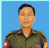
ဗိုလ်ကြီးပေါ်လာ