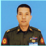
ဗိုလ်မှူးညီညီတင်