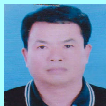
ဦးဂူဆာ လီဆူတိုင်းရင်းသားလူမျိုး ကိုယ်စားလှယ်