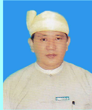
ဦးစင်အောင်မြတ်(၁)ဦးအောင်မြတ် လွှတ်တော်ဒုတိယဥက္ကဋ္ဌ ရွာငုံ(၂)