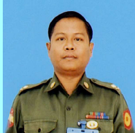
ဗိုလ်မှူးရဲမြတ်ထွန်း