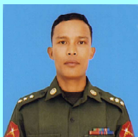
ဗိုလ်ကြီးကျော်ခန့်