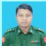
ဗိုလ်ကြီးမြတ်မင်းအောင်