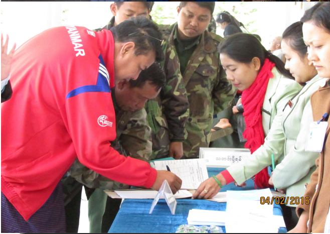
ဒုတိယအကြိမ်ရှမ်းပြည်နယ်လွှတ်တော်အစည်းအဝေးသို့ တက်ရောက်လာကြသော လွှတ်တော်ကိုယ်စားလှယ်များ တက်ရောက်မှုလက်မှတ်ရေးထိုးနေစဉ်

ဒုတိယအကြိမ်ရှမ်းပြည်နယ်လွှတ်တော် ပထမပုံမှန်အစည်းအဝေးတွင် သတင်းMedia များအား ခွင့်ပြုဆောင်ရွက်မှုအခြေအနေ (၈-၂-၂၀၁၆)ရက်နေ့တွင် ကျင်းပပြုလုပ်သော ဒုတိယအကြိမ် ရှမ်းပြည်နယ်လွှတ်တော် ပထမပုံမှန် အစည်းအဝေးတွင် သတင်းMedia များအား လွတ်လပ်စွာ သတင်းရယူနိုင်ရန်အတွက် သတင်းရယူခွင့်တင်ပြ လာသော ရှမ်းပြည်နယ်ပြန်ကြားရေးနှင့် ပြည်သူ့ဆက်ဆံရေးဦးစီးဌာန၊ Southern Shan State Media Network၊ သျမ်းသံတော်ဆင့်၊ Myanmar's Time၊ The People's Voice၊ Seven Day News၊ Eleven Media Group တို့အား ခွင့်ပြုပေးခဲ့ပါသည်။