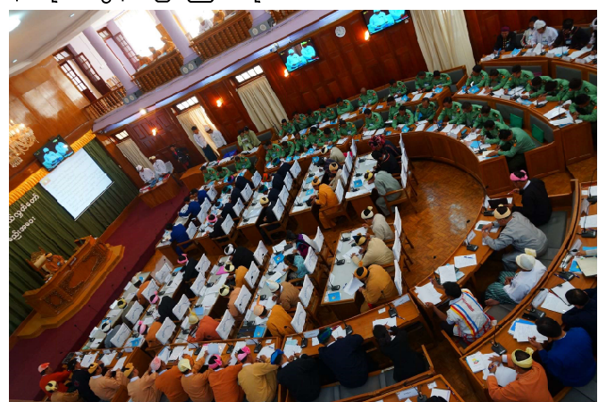
ဒုတိယအကြိမ်ရှမ်းပြည်နယ်လွှတ်တော်ဥက္ကဋ္ဌဦးစိုင်းလုံးဆိုင်က အမှာစကား ပြောကြားနေစဉ်

ရှမ်းပြည်နယ်လွှတ်တော်ကိုယ်စားလှယ်များသည် ရှမ်းပြည်နယ်အတွင်း ဒေသအသီးသီး၊ အလွှာအသီးသီး၌ အဖွဲ့ အစည်းအသီးသီးက ကိုယ်စားလှယ်များဖြစ်ပြီး၊ တိုင်းရင်းသား ပေါင်းစုံပါဝင်လျက်ရှိပါတယ်။ လွှတ်တော်တာဝန်များကို ထမ်းဆောင်ရာမှာ တစ်ဦးကို တစ်ဦး ယုံယုံကြည်ကြည်ရင်းရင်း နှီးနှီးဆွေးနွေးတိုင်ပင်ညှိနှိုင်းခြင်းဖြင့် ရှမ်းပြည်နယ်၏ ကောင်းမွန်သည့် သမိုင်းသစ်ကို ရေးကြရာမှာဖြစ်ပါတယ်။ လွှတ်တော်မှာပါတီစွဲ၊ ဒေသစွဲ၊ လူမျိုးစွဲ မထားဘဲနှင့် နိုင်ငံသူ /နိုင်ငံသားများ၏ အကျိုးစီးပွားအတွက် အတတ်နိုင်ဆုံး လက်တွဲပူးပေါင်းပါဝင်ဆောင်ရွက်ကြရန် ပထမအချက်အနေ နဲ့ တိုက်တွန်းပြောကြားလိုပါတယ်။