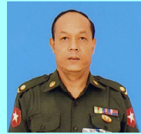
ဗိုလ်မှူးသန်းထွန်းဦး