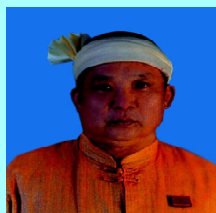
ဦးစိုင်းစွံဆိုင်း တာချီလိတ်(၁)