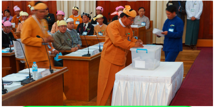
ပြည်နယ်လွှတ်တော်ကိုယ်စားလှယ်များ လျှို့ဝှက်ဆန္ဒမဲပေးနေပုံ