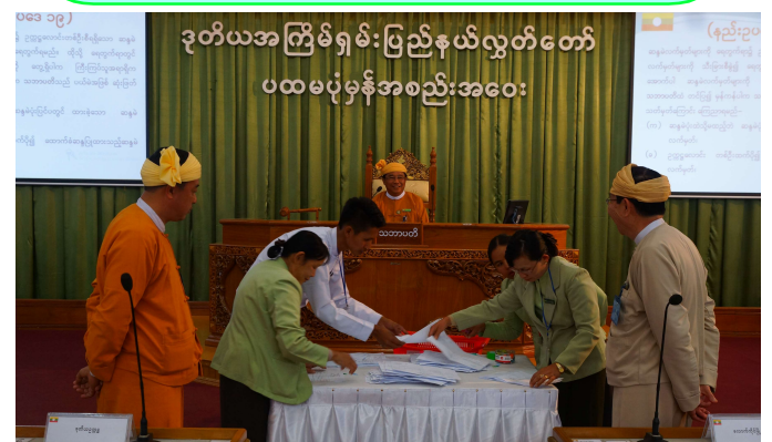
လျှို့ဝှက်ဆန္ဒမဲများအား ရွှေ့မှောက်တွင် ရေတွက်စစ်ဆေးနေပုံ