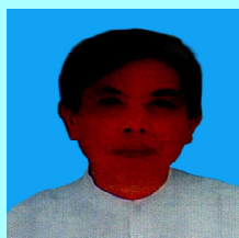
ဦးစိုင်းလှဝင်း မိုင်းယုဦး(၂)