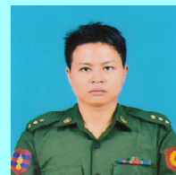
ဗိုလ်ကြီးကျော်စင်အောင်