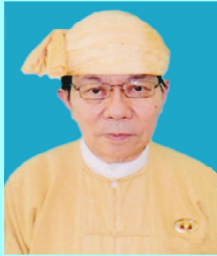
ဦးစိုင်းလုံးဆိုင် လွှတ်တော်ဥက္ကဋ္ဌ ကျိုင်းတုံ(၁)