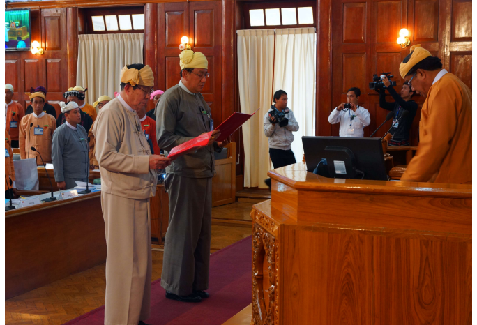
ရှမ်းပြည်နယ်လွှတ်တော်ဥက္ကဋ္ဌနှင့် ဒုတိယဥက္ကဋ္ဌ ကတိသစ္စာပြုနေစဉ်

(၈. ၂. ၂၀၁၆)ရက်နေ့(၁၁:၀၀)နာရီအချိန်တွင် ပြည်နယ်လွှတ်တော်ဥက္ကဋ္ဌ ဦးစိုင်းလုံးဆိုင်နှင့် ဒုတိယဥက္ကဋ္ဌ ဦးစစ်အောင်မြတ်(ခ)ဦးအောင်မြတ်တို့သည် ကတိသစ္စာပြုခြင်းနှင့် ကတိသစ္စာပြုလွှာ ပေါ်တွင် လက်မှတ်ရေးထိုးခြင်းများ ဆောင်ရွက်ခဲ့ပါသည်။