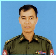
ဗိုလ်မှူးအောင်နိုင်ထွန်း