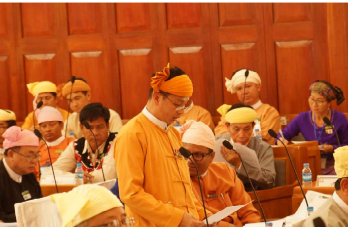
ဘဏ္ဍာရေးဝန်ကြီး၊ ဦးစိုင်းရှန်တစ်လုံမှ ကြယ်ပွင့်ပြ မေးခွန်းအားဖြေကြားနေစဉ်