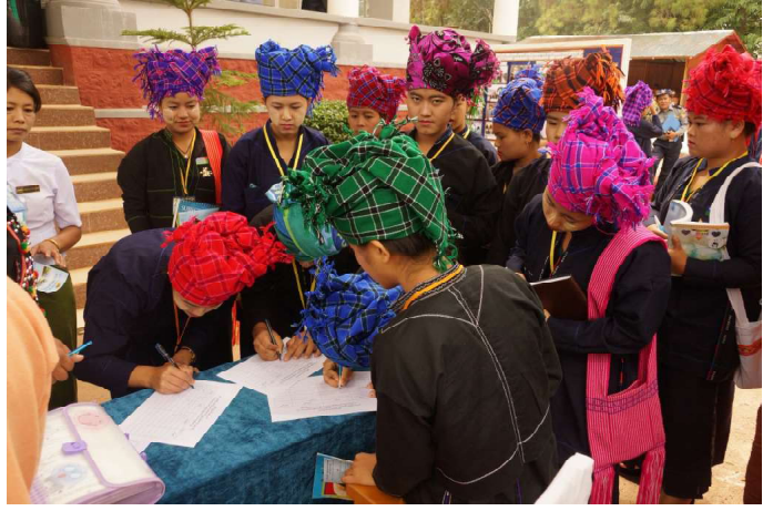
ပအိုဝ်းအမျိုးသမီးသမဂ္ဂအဖွဲ့မှ ရှမ်းပြည်နယ်လွှတ်တော်သို့ လာရောက်လေ့လာခြင်း