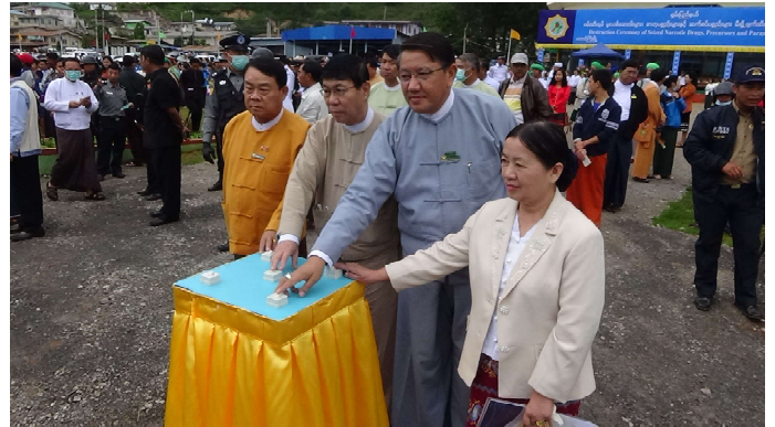
ရှမ်းပြည်နယ်လွှတ်တော် ဥက္ကဋ္ဌ၊ ဒုတိယဥက္ကဋ္ဌနှင့် ပြည်နယ်စာရင်းစစ်ချုပ်တို့မှ မူးယစ်ဆေးဝါးများကို စက်ခလုတ်နှိပ် မီးရှို့ဖျက်ဆီးနေစဉ်

ရှမ်းပြည်နယ်လွှတ်တော် ဥက္ကဋ္ဌ၊ ဦးစိုင်းလုံးဆိုင်နှင့် ဒုတိယဥက္ကဋ္ဌ ဦးစစ်အောင်မြတ်သည် (၂၆-၆-၂၀၁၇)ရက် နေ့တွင် ရှမ်းပြည်နယ် အပြည်ပြည်ဆိုင်ရာ မူးယစ်ဆေးဝါး အလွဲသုံးမှုနှင့် တရားမဝင်ရောင်းဝယ်မှုတိုက်ဖျက်ရေးနေ့ အထိမ်းအမှတ် အခမ်းအနားသို့ တက်ရောက်ခဲ့ပြီး မူးယစ်ဆေးဝါးများကို စက်ခလုတ်နှိပ် မီးရှို့ဖျက်ဆီးခဲ့ပါသည်။