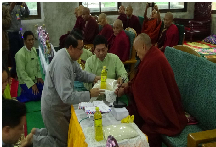
ရှမ်းပြည်နယ်လွှတ်တော် ဒုတိယဥက္ကဋ္ဌ ဦးစစ်အောင်မြတ်မှ လှူဖွယ်ဝတ္ထုပစ္စည်းဆက်ကပ်လှူဒါန်းနေစဉ်

ရှမ်းပြည်နယ်လွှတ်တော် ဒုတိယဥက္ကဋ္ဌ ဦးစစ်အောင်မြတ်သည် (၂၁-၇-၂၀၁၇)ရက်နေ့တွင် ဓနကိုယ်ပိုင်အုပ်ချုပ်ခွင့်ရ ဒေသ၊ ရွာငံမြို့နယ် မြို့နယ်လုံးကျွတ်ဝါဆိုသင်္ကန်း ဆက်ကပ်လှူဒါန်းပွဲ အခမ်းအနားသို့ တက်ရောက်ကာ လှူဖွယ်ဝတ္ထု ဆက်ကပ်လှူဒါန်းခဲ့ပါသည်။