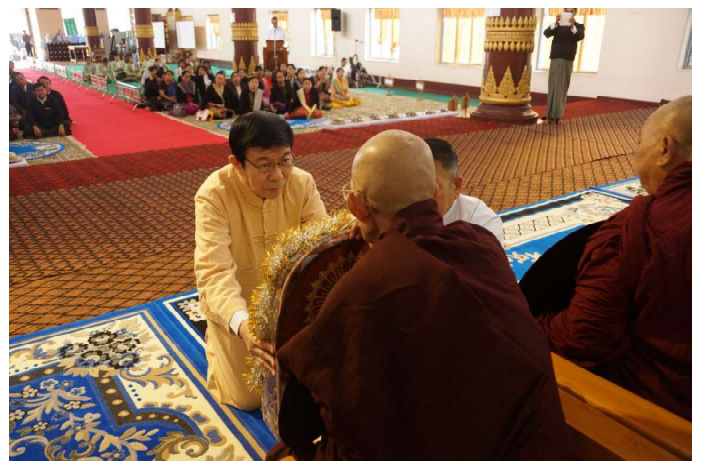
ရှမ်းပြည်နယ်လွှတ်တော်ဥက္ကဋ္ဌ၊ ဦးစိုင်းလုံးဆိုင်က အာဇာနည်နေ့တွင် ဆရာတော်၊ သံဃာတော်များအား လှူဖွယ်ဝတ္ထုဆက်ကပ်နေစဉ်