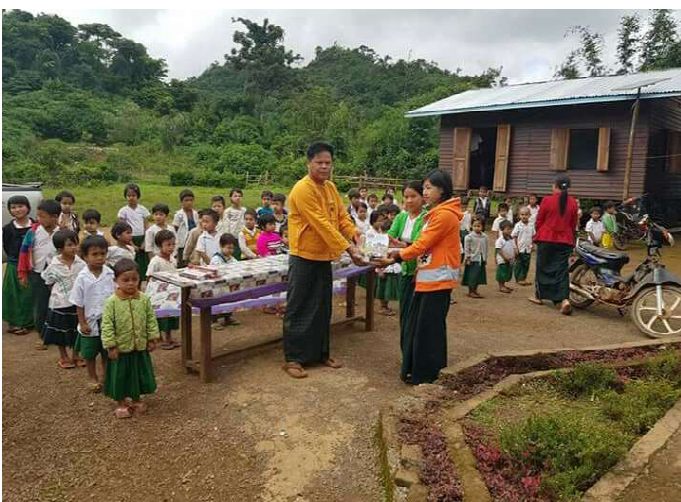
ရွာငုံမြို့နယ် မဲဆန္ဒနယ်အမှတ်(၁)၊ ဦးအေးမင်းစိုးမှ ကျောင်းသား၊ ကျောင်းသူများအား ထောက်ပံ့လှူဒါန်းနေစဉ်