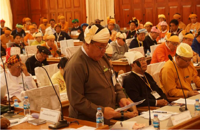
စိုက်ပျိုးရေး၊ မွေးမြူရေးနှင့် ဆည်မြောင်းဝန်ကြီး ဦးစိုင်းလုံကျော်မှ ကြယ်ပွင့်ပြမေးခွန်းအားဖြေကြားနေစဉ်

ဒုတိယအကြိမ် ရှမ်းပြည်နယ်လွှတ်တော် ဆဌမပုံမှန် အစည်းအဝေးတွင် လွှတ်တော်ကိုယ်စားလှယ်(၁၈)ဦးတို့၏ ကြယ်ပွင့်ပြမေးခွန်း ၄၂ခု မေးမြန်းခြင်း၊ ဖြေကြားခြင်းကို ဆောင်ရွက်ခဲ့ပါသည်။