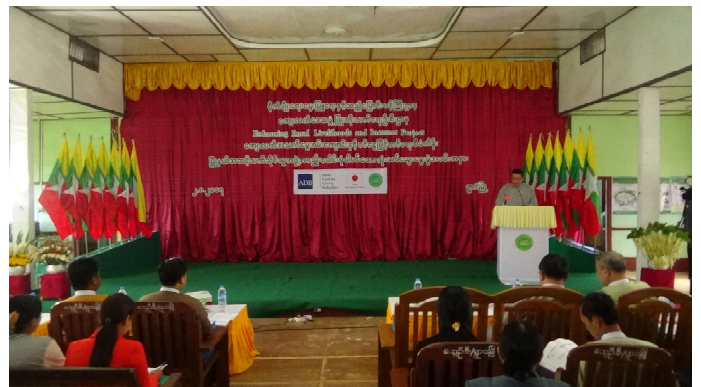
ရှမ်းပြည်နယ်လွှတ်တော် ဒုတိယဥက္ကဋ္ဌ ဦးစစ်အောင်မြတ်မှ အခမ်းအနားတွင် အမှာစကားပြောကြားနေစဉ်

ရှမ်းပြည်နယ်လွှတ်တော် ဒုတိယဥက္ကဋ္ဌ ဦးစစ်အောင်မြတ် သည် (၂-၈-၂၀၁၇)ရက်နေ့တွင် ဓနကိုယ်ပိုင်အုပ်ချုပ်ခွင့်ရ ဒေသ၊ ရွာငံမြို့၌ စိုက်ပျိုးရေး၊ မွေးမြူရေးနှင့် ဆည်မြောင်းဝန်ကြီးဌာန၊ ကျေးလက်ဒေသဖွံ့ဖြိုးတိုးတက်ရေး ဦးစီးဌာနမှ ကျင်းပသော ကျေးလက်အသက်မွေးဝမ်းကျောင်း နှင့် ဝင်ငွေမြှင့်တင်ရေးစီမံကိန်း၊ မြို့နယ်အဆင့်သက်ဆိုင်သူ အဖွဲ့အစည်းပေါင်းစုံ ပါဝင်သော သုံးသပ်ဆွေးနွေးပွဲ အခမ်းအနားသို့ တက်ရောက်ခဲ့ပြီး အမှာစကားပြောကြားခဲ့ ပါသည်။