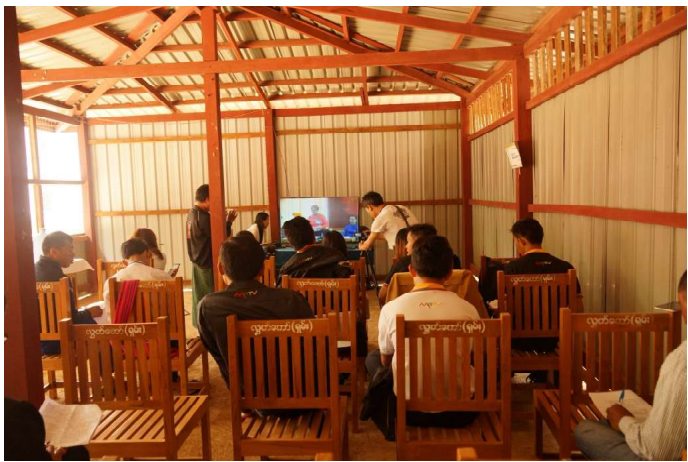
မိဒီယာများမှ မိဒီယာခန်းတွင်လာရောက်သတင်းယူနေစဉ်

အခန်း (၅)မှာ စီမံခန့်ခွဲရေးနည်းလမ်းများ အရေးယူ ဆောင်ရွက်ခြင်းအတွက် ပုဒ်မ ၈နှင့် ပုဒ်မ ၉ ပုဒ်မနှစ်ခုကို ထည့်သွင်း ရေးဆွဲထားပါတယ်။ အရေးယူ ဆိုင်းငံ့ခြင်း သို့မဟုတ် ပယ်ဖျက်ခြင်း သို့မဟုတ် ဒဏ်ငွေဆောင်ခြင်း နည်းလမ်း(၃)သွယ်နှင့် အရေးယူဖို့ရန်အတွက် ပုဒ်မ ၈ ကို ရေးဆွဲ ထားခြင်းဖြစ်ပြီး ပုဒ်မ ၉ မှာ သတ်မှတ်ထားသော ဒဏ်ငွေကို မဆောင်လျှင် တရားစွဲနိုင်ရန်အတွက် ထည့်သွင်းရေးဆွဲထားပါတယ်။