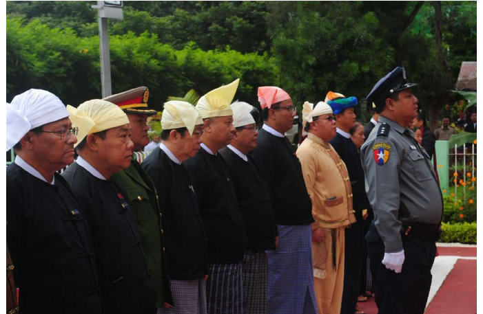
ရှမ်းပြည်နယ်လွှတ်တော်ဥက္ကဋ္ဌ၊ ဦးစိုင်းလုံးဆိုင်က အာဇာနည်နေ့ အခမ်းအနားသို့ တက်ရောက်စဉ်

ရှမ်းပြည်နယ်လွှတ်တော် ဥက္ကဋ္ဌ ဦးစိုင်းလုံးဆိုင်မှ နှစ် (၇၀)ပြည့် အာဇာနည်နေ့ ဝမ်းနည်းခြင်းအထိမ်းအမှတ် လွှမ်းသူးပန်းခွေချ ဆုတောင်းခြင်းနှင့် ဆရာတော်များအား နေ့ဆွမ်းဆက်ကပ် အခမ်းအနားတက်ရောက်