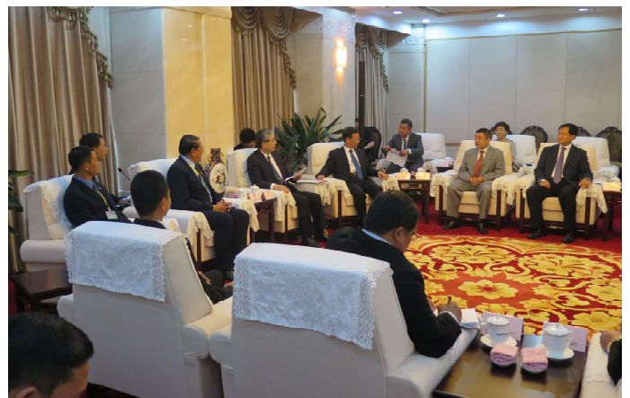
ရှမ်းပြည်နယ်လွှတ်တော် ဒုတိယဥက္ကဋ္ဌ ဦးဆောင်သည့် ပြည်နယ်လွှတ်တော်ကိုယ်စားလှယ်များအဖွဲ့နှင့် တွေ့ဆုံ ဆွေးနွေးသည့် မှတ်တမ်းဓာတ်ပုံ

ရှမ်းပြည်နယ်လွှတ်တော် ဒုတိယဥက္ကဋ္ဌ ဦးစစ်အောင်မြတ် ခေါင်းဆောင်သော ရှမ်းပြည်နယ် လွှတ်တော်ကိုယ်စားလှယ်အဖွဲ့သည် တရုတ်ပြည်သူ့ သမ္မတနိုင်ငံ ကောင်စစ်ဝန်ချုပ်ရုံးမှတစ်ဆင့် ယူနန်ပြည်နယ်၊ ပြည်သူ့ကွန်ကရက်၏ ဖိတ်ကြားချက်အရ တရုတ် ပြည်သူ့ သမ္မတနိုင်ငံ၊ ရှန်ဟိုင်းမြို့နှင့် ပေကျင်းမြို့များသို့(၁၇-၆-၂၀၁၇) ရက်နေ့မှ(၂၄-၆-၂၀၁၇)ရက်နေ့အထိ အောက်ပါပုဂ္ဂိုလ်များ သွားရောက်လေ့လာခဲ့ကြပါသည်-