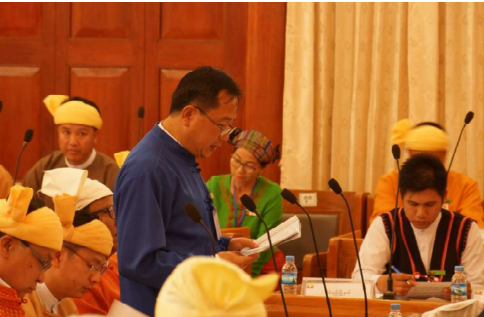
လူမှုရေးဝန်ကြီး ဒေါက်တာမျိုးထွန်းမှ ကြယ်ပွင့်ပြ မေးခွန်းအားဖြေကြားနေစဉ်