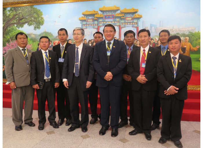
ရှမ်းပြည်နယ်လွှတ်တော် ဒုတိယဥက္ကဋ္ဌနှင့် ပြည်နယ်လွှတ်တော်ကိုယ်စားလှယ်များ၏ အမှတ်တရမှတ်တမ်းဓာတ်ပုံ