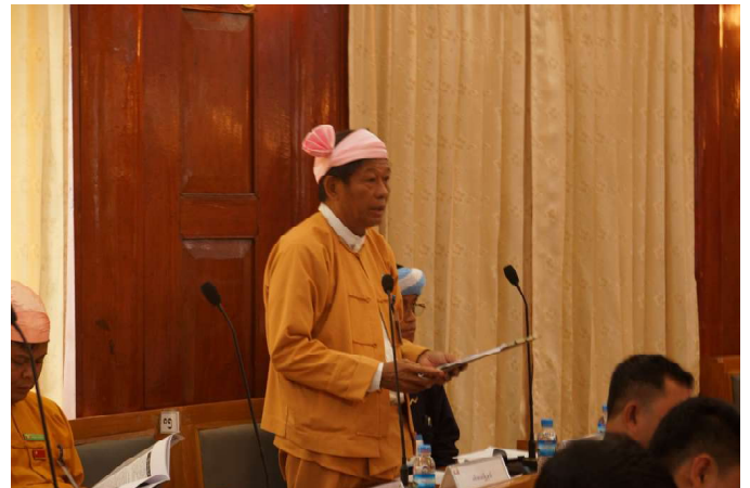
ပင်းတယမြို့နယ်၊ မဲဆန္ဒနယ်အမှတ်(၂)၊ ပြည်နယ်လွှတ်တော် ကိုယ်စားလှယ် ဦးစိုင်းလှဝင်းမှ ကြယ်ပွင့်ပြမေးခွန်းမေးမြန်းနေစဉ်