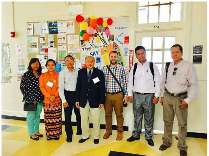
ဖယ်ခုံမြို့နယ် မဲဆန္ဒနယ်အမှတ်(၁)၊ ဒေါ်မေရီနီမှ အမေရိကသို့ သွားရောက်လေ့လာသည့် မှတ်တမ်းဓါတ်ပုံ