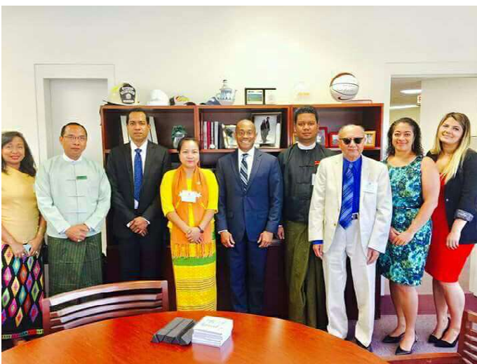
ဖယ်ခုံမြို့နယ် မဲဆန္ဒနယ်အမှတ်(၁)၊ ဒေါ်မေရီနီမှ အမေရိကသို့ သွားရောက်လေ့လာသည့် မှတ်တမ်းဓါတ်ပုံ