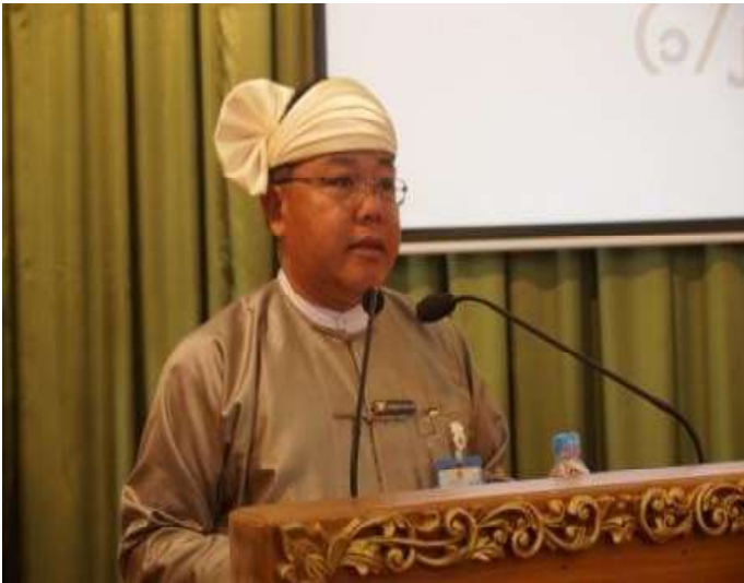
စိုက်ပျိုးရေး၊ မွေးမြူရေးနှင့် ဆည်မြောင်းဝန်ကြီး၊ ဦးစိုင်းလုံကျော်မှ အဆိုပြုတင်သွင်းနေစဉ်

ရှမ်းပြည်နယ်အစိုးရအဖွဲ့ဝင်၊ လုံခြုံရေးနှင့် နယ်စပ်ရေးရာဝန်ကြီး အစားထိုးပြောင်းလဲတာဝန် ပေးအပ်သည့် တပ်မတော်သား ပြည်နယ် လွှတ်တော်ကိုယ်စားလှယ် အမည်စာရင်းအား ရှမ်းပြည်နယ်အစိုးရအဖွဲ့မှ ပြည်နယ်လွှတ်တော်သို့ အဆိုပြုတင်သွင်းခြင်း။