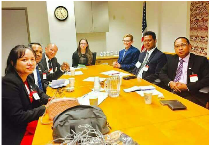
ဖယ်ခုံမြို့နယ် မဲဆန္ဒနယ်အမှတ်(၁)၊ ဒေါ်မေရီနီမှ အမေရိကသို့ သွားရောက်လေ့လာသည့် မှတ်တမ်းဓါတ်ပုံ