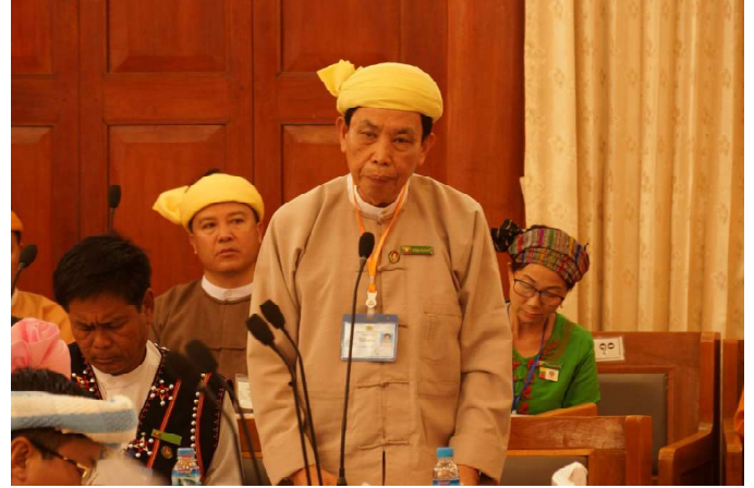
မိုင်းပျဉ်းမြို့နယ်၊ မဲဆန္ဒနယ်အမှတ်(၂)၊ ပြည်နယ်လွှတ်တော် ကိုယ်စားလှယ် ဦးစိုင်းလှဝင်းမှ ကြယ်ပွင့်ပြမေးခွန်းမေးမြန်းနေစဉ်